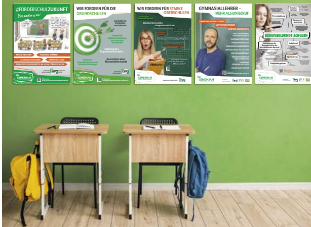
Bildmontage/Plakate: Satztechnik Meißen, Foto: © Pixel-Shot – stock.adobe.com